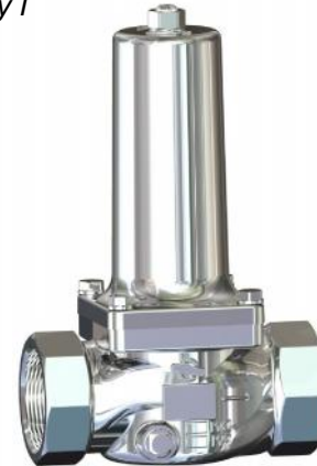
DN 40 - DN 50