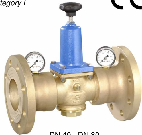
DN 40 - DN 80

(Ausführung DN 65 & 80 mit separaten Manometeranschlüssen / version DN 65 & 80 with separate manometer connections)