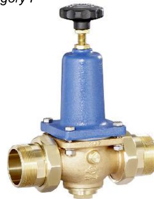
DN 40 - DN 65 (DRV 402-6)