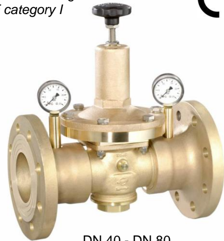
DN 40 - DN 80

(Ausführung DN 65 & 80 mit separaten Manometeranschlüssen / design DN 65 & 80 with separate manometer connections)