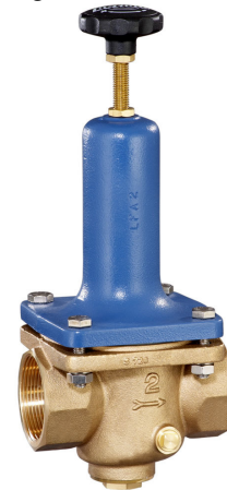
DN 32 - DN 50