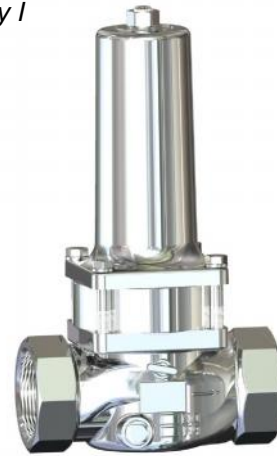
DN 40 - DN 50