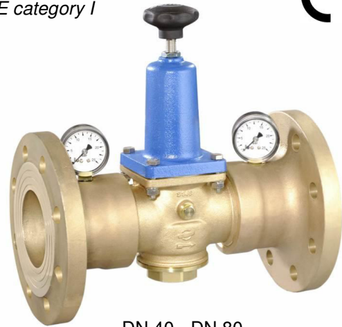
DN 40 - DN 80

(Ausführung DN 65 & 80 mit separaten Manometeranschlüssen / version DN 65 & 80 with separate manometer connections)