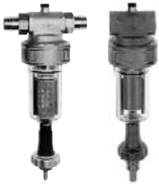
1142 BR 1140 BR

PN 16 aus Messing, Bürstenfilter mit Rückfluss-Reinigung, mit Feinfilter aus rostfreiem Stahl